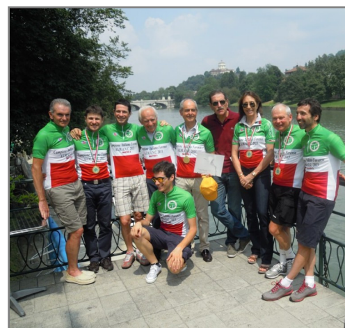
Gli avvocati campioni d'Italia 2013