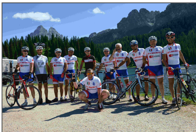
Cortina: Lago di Misurina