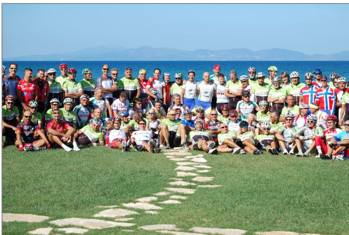
Campionato Italiano Forense 2013 – Castiglion Della Pescaia (Grosseto)

2) 14-15-16 giugno 2013 cronoscalata e gara in linea a Torino organizzata dall'Avv Guido Conte, vedi l'intenso programma pubblicato nell'AIMANC - www.aimanc.it e/o AIMANC su FB